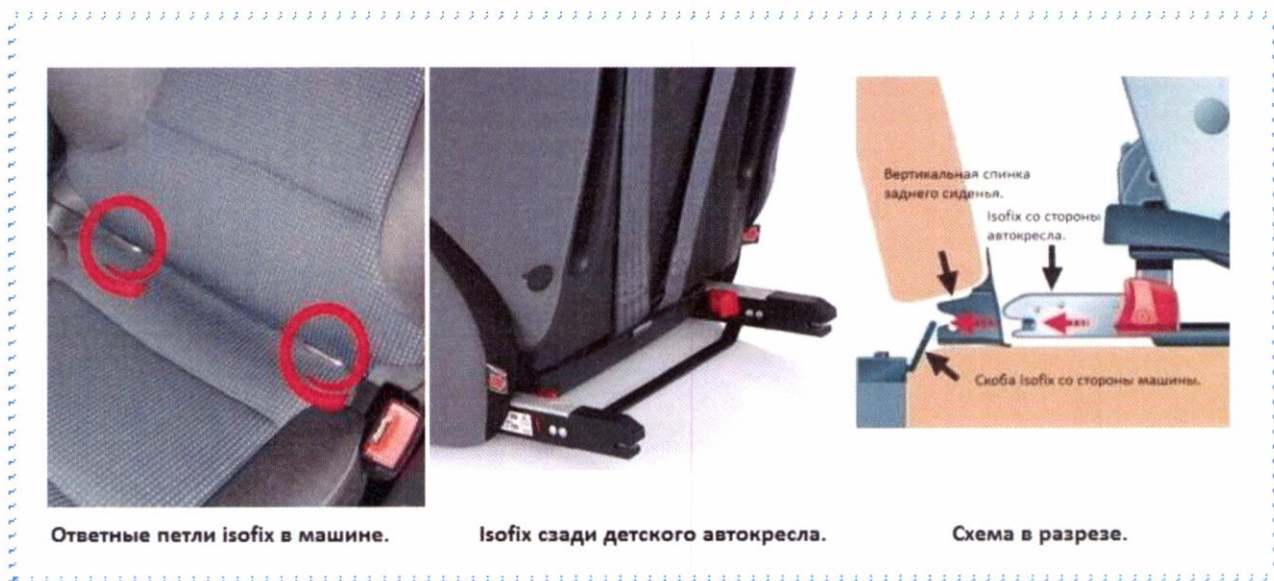
Рисунок 5. Крепления ISOFIX

Система крепления ISOFIX дает возможность быстрого и надежного крепления. За счет быстрозажимных устройств кресло надежно фиксируется и также легко снимается. Не приходится лишний раз беспокоить ребенка.