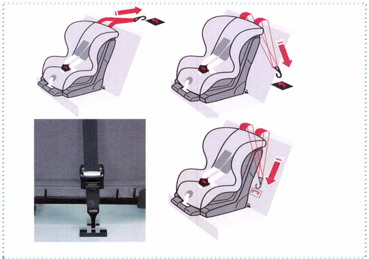
Рисунок 7. Способы фиксации якорного крепления

После того, как автокресло установлено, необходимо учесть ряд условий при усаживании в него ребенка.