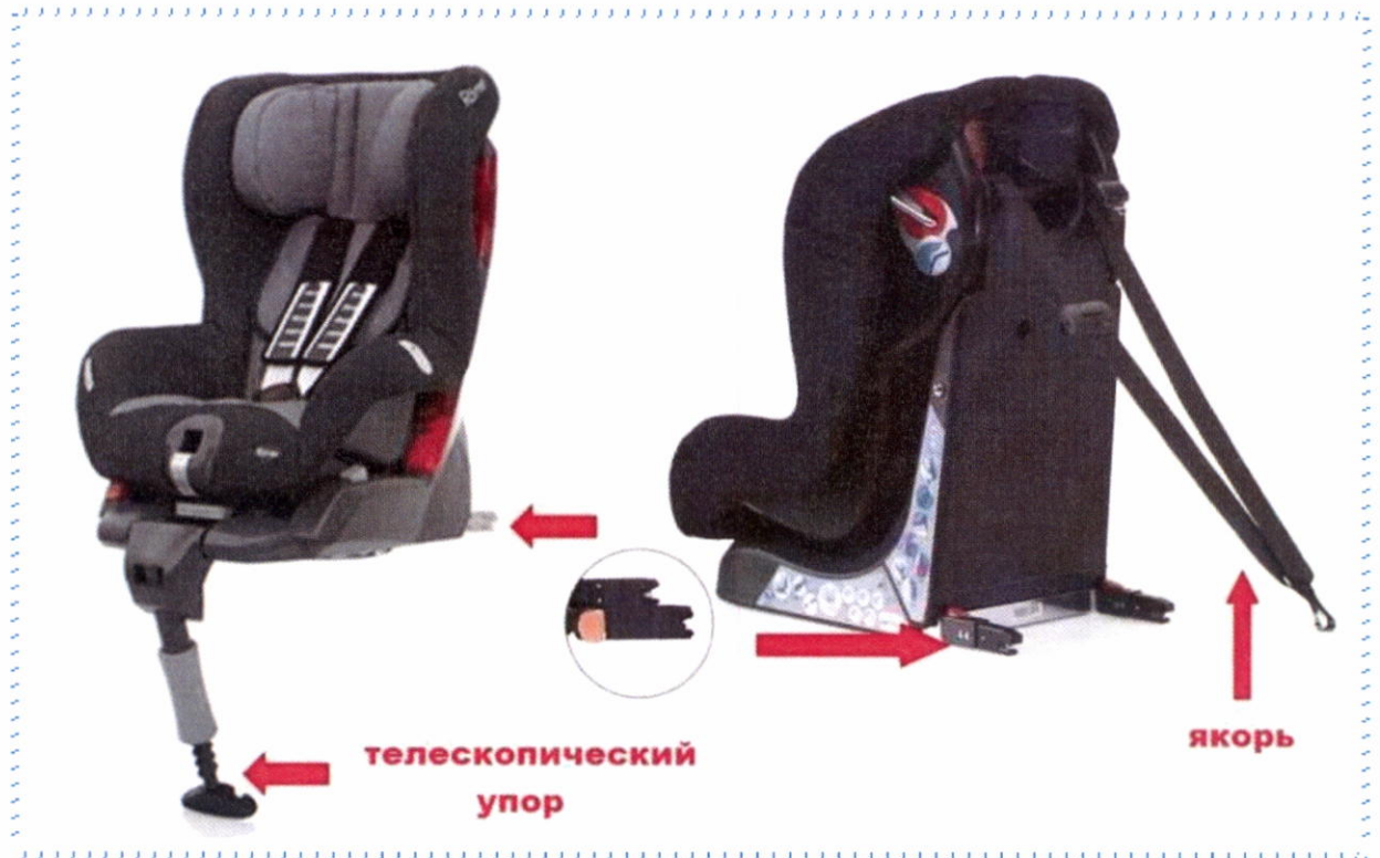
Рисунок 6. Телескопический упор и якорное крепление

Телескопический упор и якорное крепление разработаны специально для того, чтобы в момент столкновения снизить нагрузку на основное крепление детского автокресла, избежать возможности «клюющего» движения при лобовом столкновении и этим обеспечить более высокую безопасность в аварийных ситуациях.