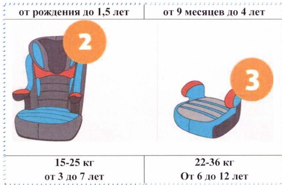
Рисунок 1. Виды детских удерживающих устройств.

Детские удерживающие устройства можно разделить по группам в зависимости от веса и возраста детей.