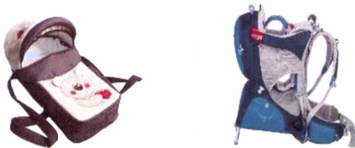
Люлька-переноска не предназначена для автомобиля