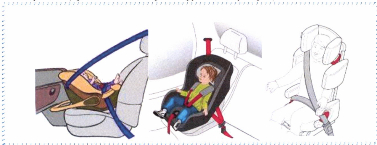
Рисунок 4. Крепление штатными ремнями безопасности

- фиксация ребенка ремнем безопасности автомобиля, вместе с детским автокреслом (применяется для кресел групп 2, 3, бустеров).